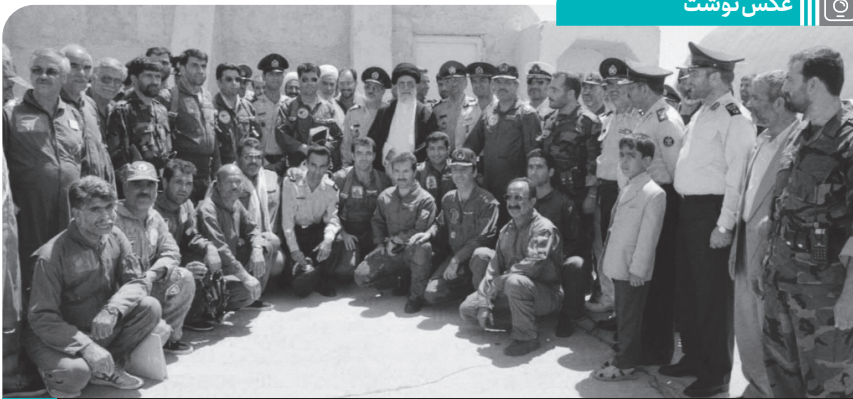
تصویری از حضور فرمانده کل قوا در حاشیه مراسم نظامی مشترک نیروهای مسلح در پایگاه سوم شکاری شهید نوژه. ۱۳۸۳/۰۴/۱۸ ●