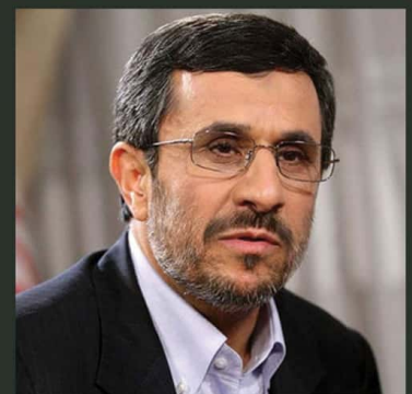
نام: محمود احمدی نژاد تاریخ تولد: ۶ آبان ۱۳۳۵ محل تولد: آرادان نام همسر: اعظم السادات فراچی

وی در دوران دهه شصت فرمانداری ماکو و خوی را برعهده داشت، از سال ۷۲ تا ۷۹ اولین استاندار دبییل انتخاب شد، در سال ۸۲ به عنوان شهردار منصوب شد، و در دوره نهم انتخابات ریاست جمهوری شرکت کرده و با کسب ۱۷ میلیون رای به عنوان رئیس جمهور در سال ۸۴ طبق آرای مردم