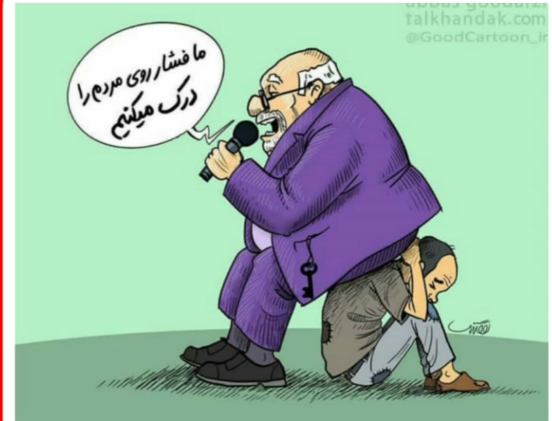
درک مسئولین از فشار وارد شده بر مردم!