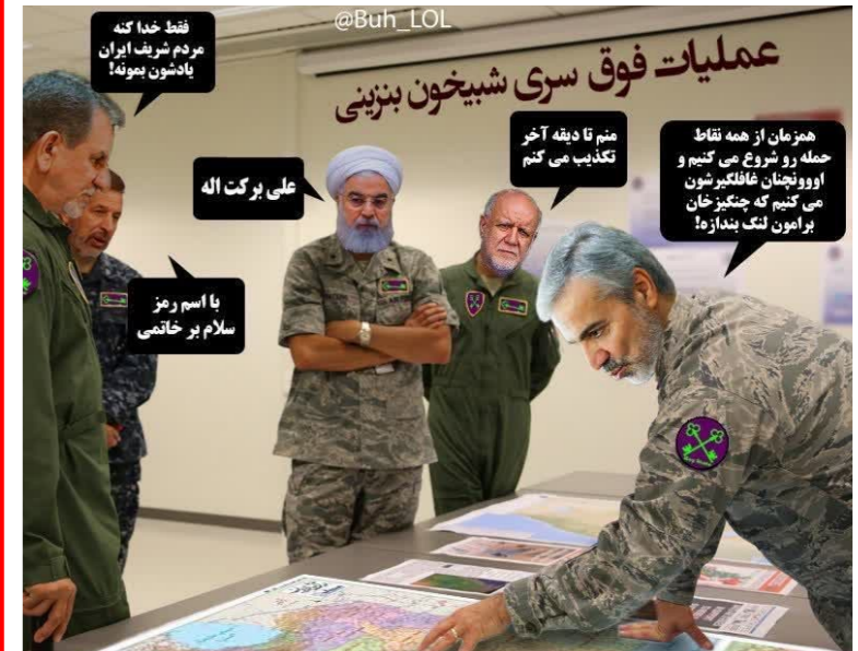
عملیات فوق سری شیخون بنزینی!