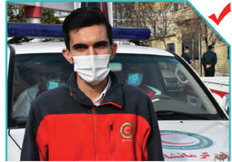
از جان خود گذشتن برای نجات جان هموعان