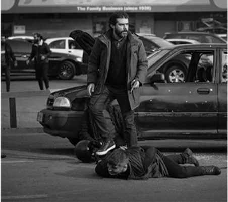
ماهنامه علمی-تحقیقی سیج دانشجوی دانشگاه آزاد اسلامی همدان (پل دوم شماره ۳۲ فروردین ۱۳۸۵)