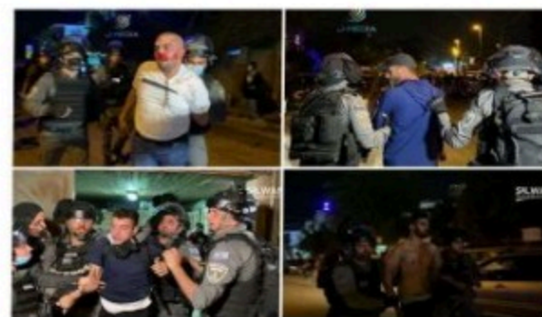
بسیج دانشجویی دانشگاه آزاد اسلامی رشت

این درگیری‌ها و هشدارهای قبلی گروه های مقاومت، سه شنبه هفته گذشته حمله موشکی به سرزمین های اشغالی در راستای حمایت از مسجدالاقصی آغاز گردید. در پی عملی کردن هشدارهای گروه های مقاومت، رژیم صهیونیستی تاب نیاورده و اقدام به جنایت و بمباران مناطق مسکونی نوار غزه کرد. اما سکوت سازمان های حقوق بشری در برابر جنایات ناجوانمردانه صهیونیست ها و جلوگیری ناجوانمردانه صهیونیست ها و جلوگیری کردن آمریکا از تشکیل نشست شورای امنیت درباره فلسطین دیگر برای ما چیز عجیب و تازه ای نیست، و مثل همیشه ثابت کرد جواب این جنایات مرد میدان می خواهد نه دیپلماسی. گروه های مقاومت بیکار ننشسته و با موشک ها و پهپاد هایشان و هدف قرار دادن مناطق استراتژیک رژیم صهیونیستی آنها را در حیرت کامل فرو بردند. اما این بار درگیری ها به خیابان ها نیز کشیده شده است، درگیری های شدید میان صهیونیست ها و فلسطینیان در سایه قدرت موشکی اعجاب آورشان در تعدادی از شهرک های صهیونیست نشین مقامات رژیم صهیونیستی رایشتر نگران کرده است. اما پایان این درگیری ها چه موقعی اتفاق خواهد افتاد؟ یا فشارهای بین‌المللی به رژیم صهیونیستی برای متوقف کردن حملات ادامه خواهد داشت، و آن ها را وادار به پایان جنگ خواهد کرد و یا با اراده قوی و عطرآگین از حاج قاسم های جبهه مقاومت، نتانیاهو را وادار خواهند کرد به دنبال یک میانجیگر باشند تا به صورت آبرومندانه خود را از این باتلاق حماقت نجات دهند. برای اینکه بدانیم اسرائیل کی نابود خواهد شد نیازی نیست به تابلوهای روزشمار نابودی اسرائیل در میداين برخی شهرها اکتفا کنیم، حماقت های دنباله دار صهیونیست ها مدت هاست عقربه ها را برای نابودی اسرائیل جلوتر برده است.