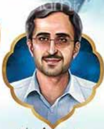
شهید مجید شیراز