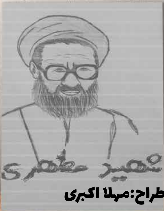
طراح: مهریلا اکبری