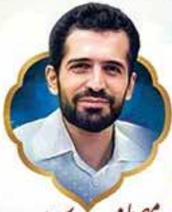
مصطفی احمد روشن شهیدی