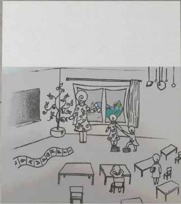
طراح: سحر رضایی