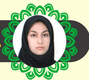
تهیه و تلخیص: