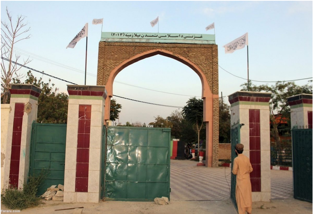
دروازه فرهنگ و تمدن اسلامی که چندی پیش در غزنی توسط طالبان تخریب شد