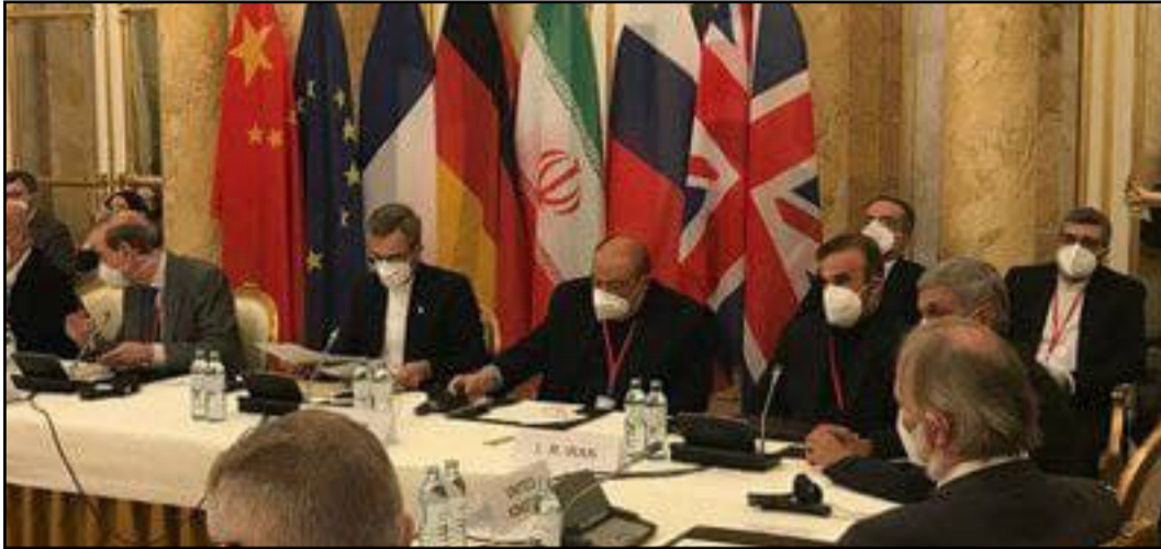
حمزه گرجه جاغرق

علت آن هم این بود که این بار تیم مذاکره کننده، نشان داد که از منافعش به هیچ وجه کوتاه نخواهد آمد، رسانه های خارجی همگی معطوف بر وین بودند و تیتراژ اخبار رسانه های جهان بود، باقری کنی و چهل نفر تیم متشکل از مشاوران، جهان را انگشت به دهان گذاشته بود و پیش نویس های ایران برای رفع تحریم ها و برنامه هسته ای، عملاً کاری کرد که کشورهای اروپایی چاره ای جز اتمام مذاکرات برای مشورت با آمریکا نداشته باشند. اما فرقی که این بار مذاکرات داشت این بود که دولت همه چیز را معطل مذاکره نکرد و تیم اعزامی به وین، خیال همگان را راحت کرد که ایران، امتیاز نخواهد داد و برای برداشتن گام هایی برا رفع تحریم ها گام به مذاکرات گذاشته است. این نشان از حسن نیت ایران بود که نشان داد برای رفع مشکلات کشور جدی است و با تیم متشکل از حقوق دانان و اقتصاددانان پا به مذاکرات گذاشت. دور هفتم مذاکرات از پنجشنبه شروع می شود. حال باید دید که این بار قدرت هایی اروپایی راه حلی برای بازگشت ایران دارند و یا باز هم سرافکننده پیش آمریکا باز می گردند.