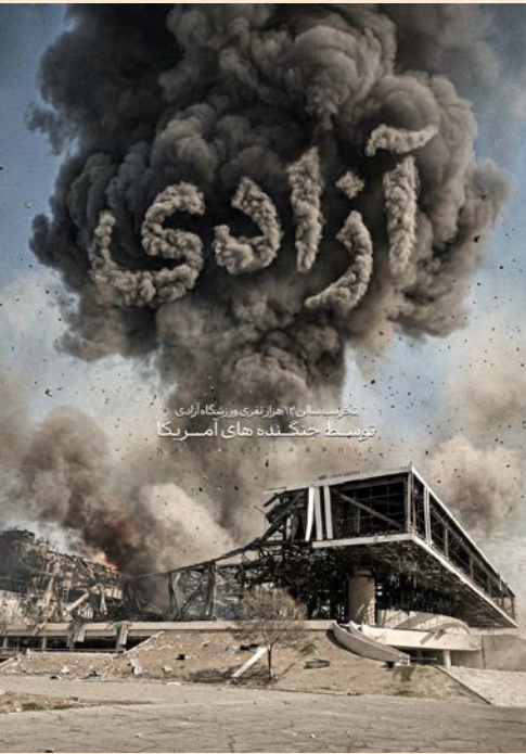
مخبرستان ۱۲: هرگز نری بوزنگاه ازبی توسط جنگنده های آمریکا

قدرت‌های جهانی آموخته‌اند که دوران استعمار مستقیم به پایان رسیده و افکار عمومی دیگر پذیرای تجاوز آشکار نیست. از این رو، جنگ‌ها و مداخلاتشان را در پوشش گفتمان‌های انسانی توجیه می‌کنند. بمب‌هایی که روزی با عنوان «امنیت ملی» فرود می‌آمدند، امروز با شعار «نجات مردم» و «دفاع از آزادی» توجیه می‌شوند. رسانه‌های جهانی و نهادهای بین‌المللی، در این میان، کارگاه‌های توجیه اخلاقی این خشونت‌اند؛ آنجا که تحریم، به «فشار انسانی» و مداخله نظامی، به «کمک بشردوستانه» ترجمه می‌شود.