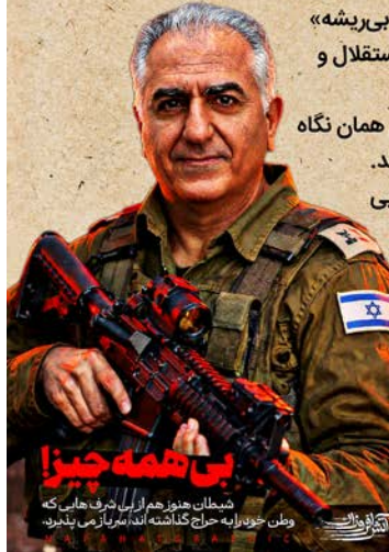
شيطان هنوز هم از بی‌شرف‌هایی که وطن خود را به حراج گذاشته اند، شریاز می‌بندد.

این اظهارات، زنگ خطری جدی است برای هوشیاری ملت ایران. نباید اجازه داد کسانی که از درون، اصالت انقلابی و ریشه‌های عمیق فرهنگی و مذهبی این ملت را هدف قرار داده‌اند، با زست‌های روشنفکرانه، ملت را فریب دهند. تاریخ، قضاوت خود را خواهد کرد و صداقت کسانی که در بزنگاه‌های حساس، هویت و استقلال خود را به بیگانگان می‌فروشند، بر همگان روشن خواهد شد.